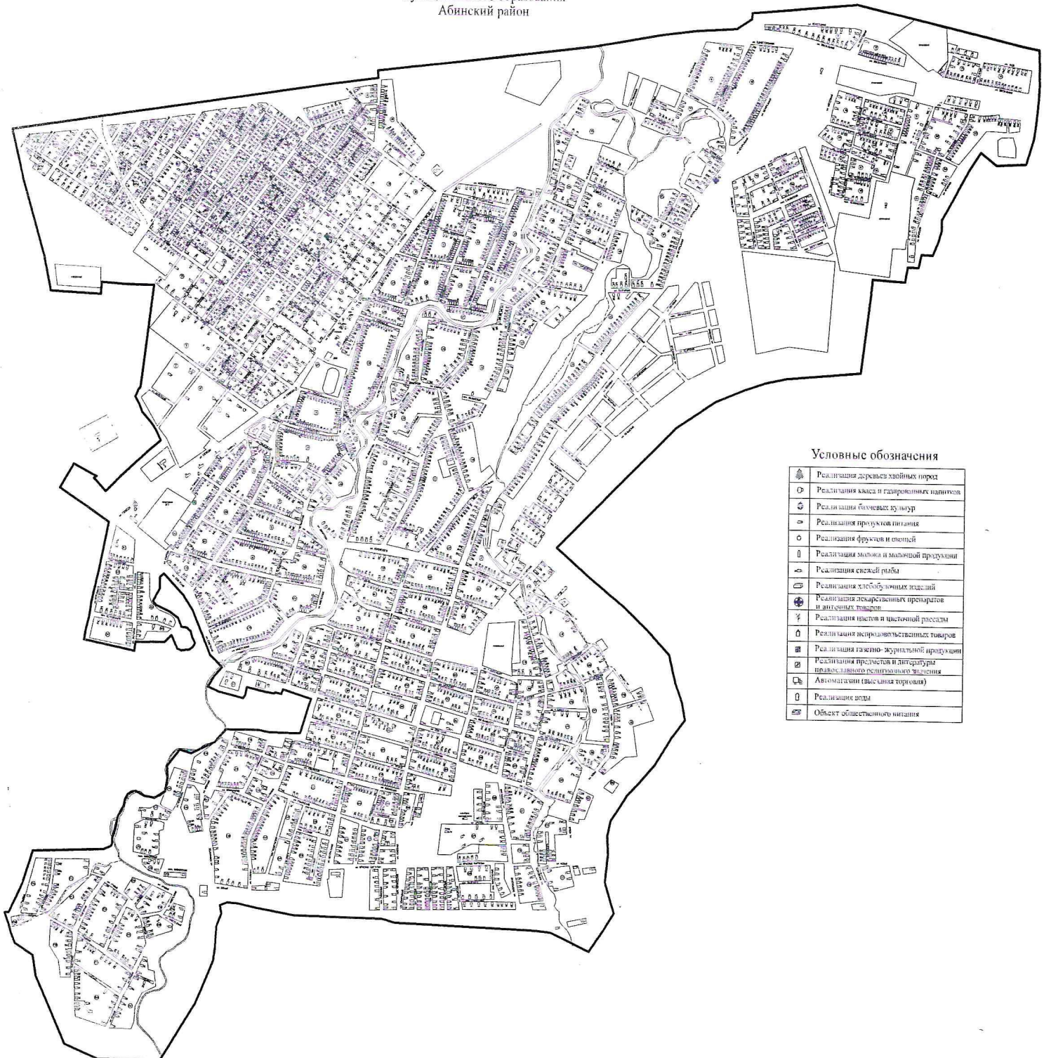
СХЕМА (графическая часть) размещения НТО на территории Ахтырского городского поселения муниципального образования Абинский район

УТВЕРЖДЕНА постановлением администрации муниципального образования Абинский район от 09.07.2025 г. № 769 (в редакции постановления администрации муниципального образования Абинский район от 29.03.20 № 544 )