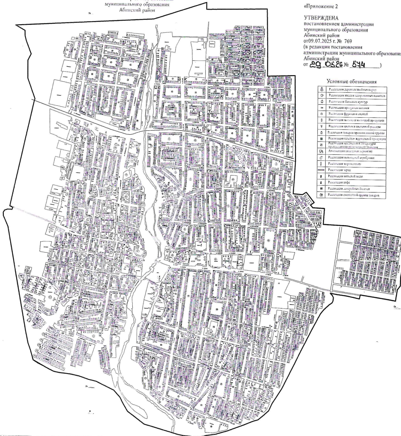
СХЕМА (графическая часть) размещения НТО на территории Абинского городского поселения муниципального образования Абинский район

Приложение 2 к постановлению администрации муниципального образования Абинский район от 29.05.26 № 574