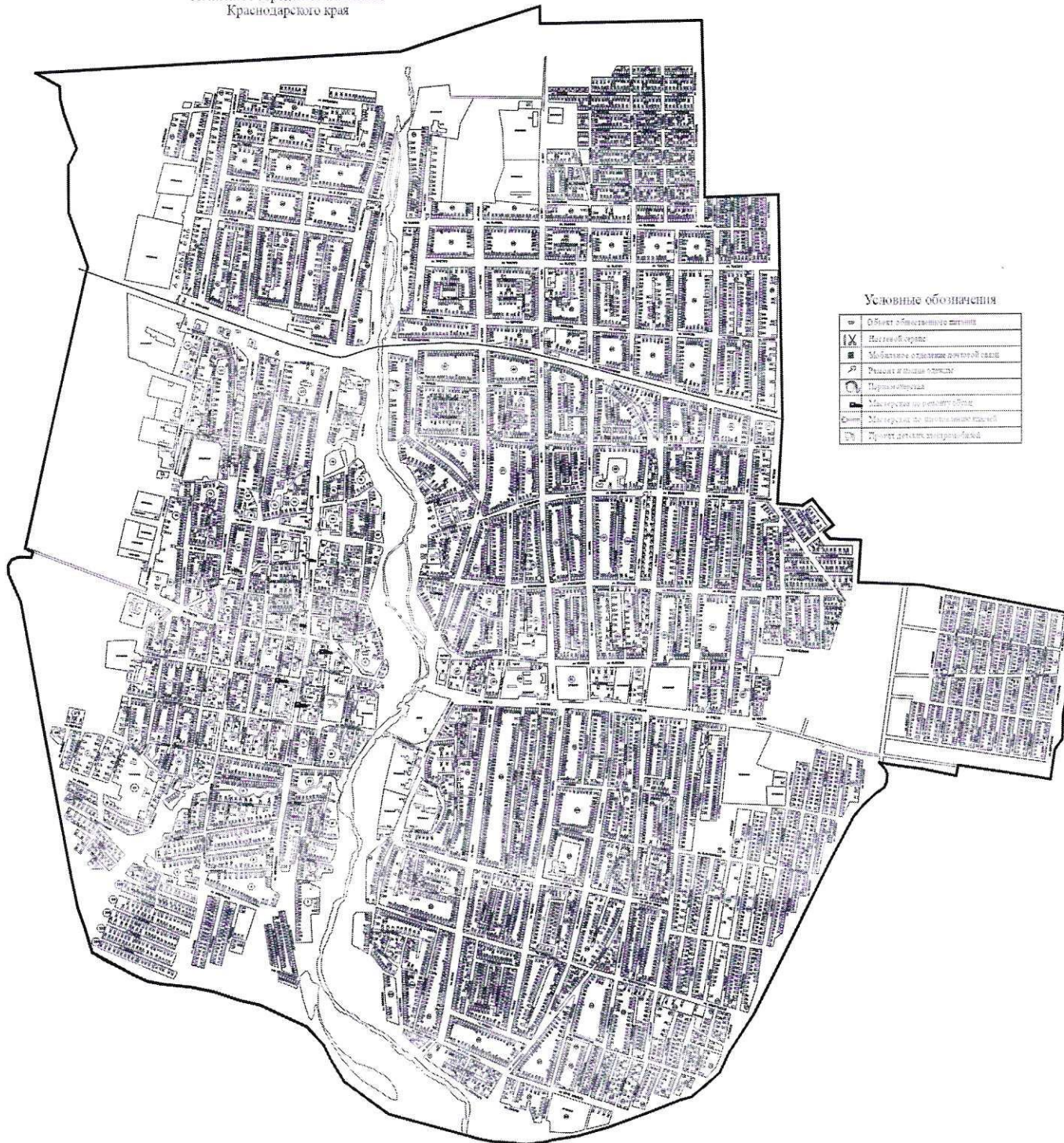
СХЕМА (графическая часть) размещения нестационарных объектов по оказанию услуг на территории Абинского городского поселения Краснодарского края

УТВЕРЖДЕНА постановлением администрации муниципального образования Абинский район от 14.12.23 № 1643