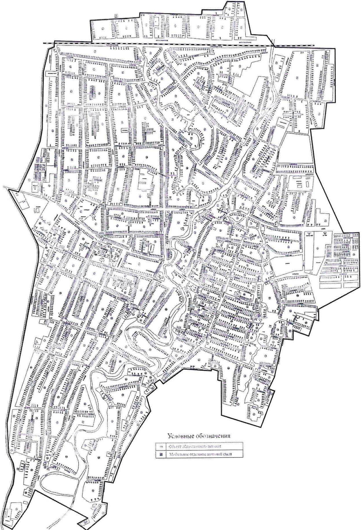
СХЕМА (графическая часть) размещения нестационарных объектов по оказанию услуг на территории Хоймского сельского поселения Краснодарского края

УТВЕРЖДЕНА постановлением администрации муниципального образования Абинский район от 24.12.23 № 1643