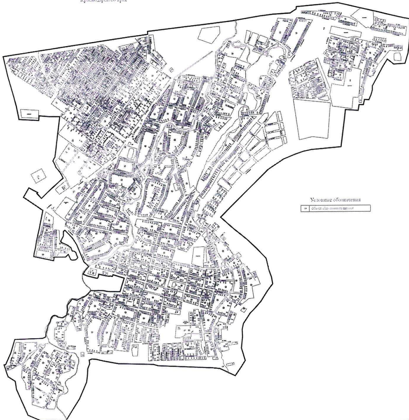
СХЕМА (графическая часть) размещения нестационарных объектов по оказанию услуг на территории Абинского городского поселения Краснодарского края

УТВЕРЖДЕНА постановлением администрации муниципального образования Абинский район от 14.11.13 № 1643