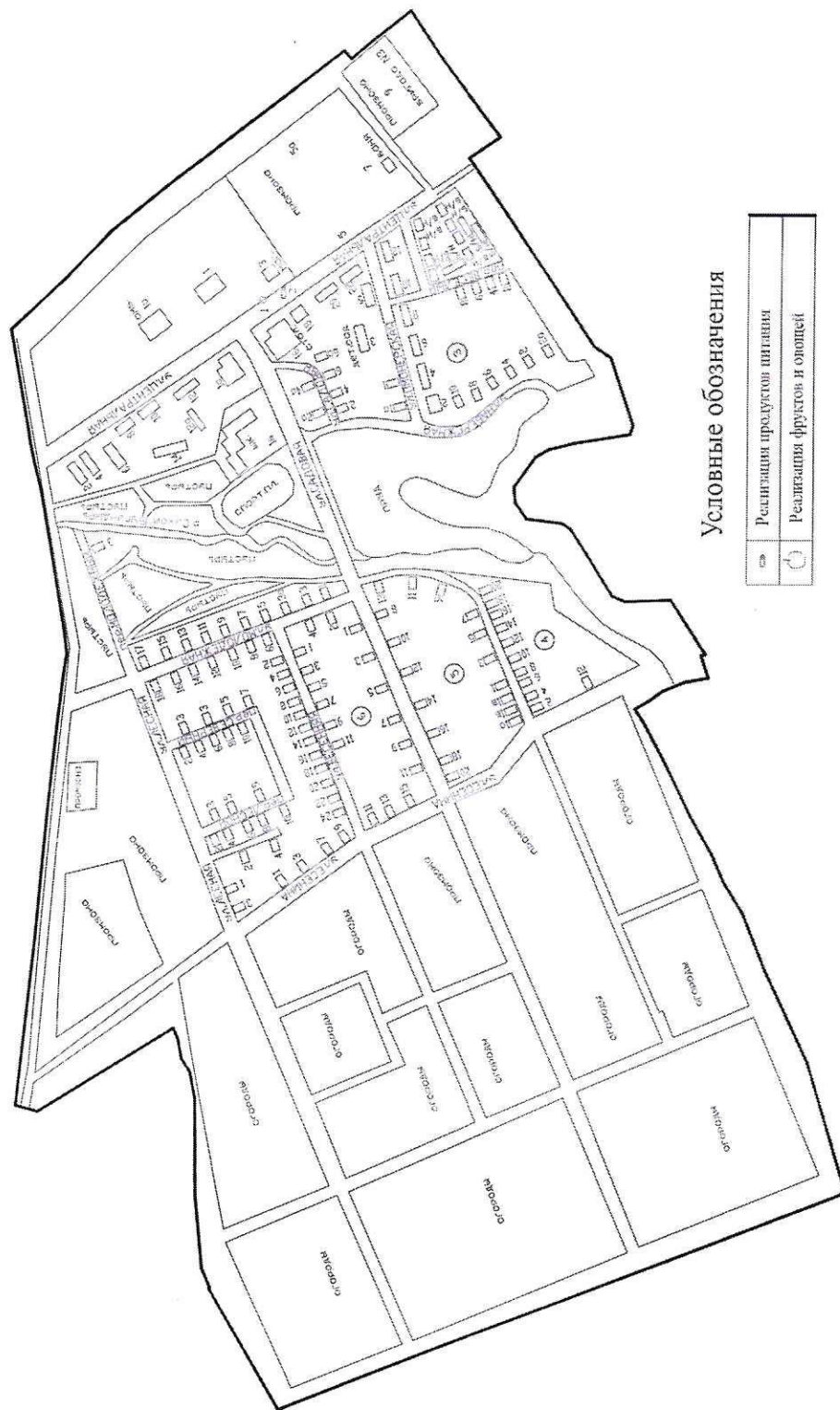
СХЕМА (графическая часть) размещения НТО на территории Светлогорского сельского поселения Краснодарского края

Приложение 5 УТВЕРЖДЕНА постановлением администрации муниципального образования Абурский район от 14.11.23 № 1642