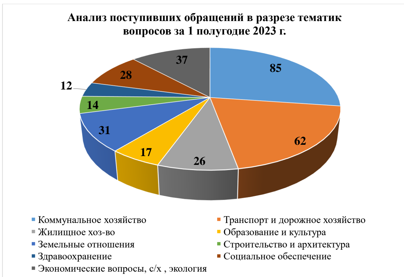
Таблица № 1.

Анализ обращений граждан показал, что в большинстве письменных обращений граждан в 2023 году поднимались вопросы: