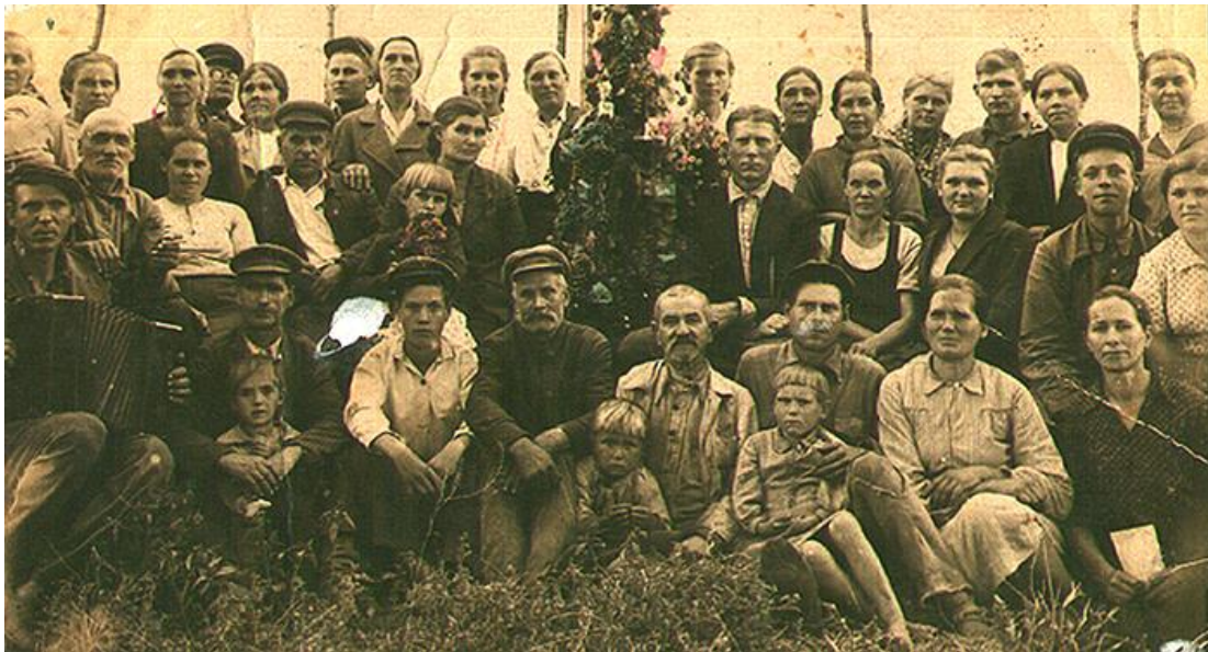
Колхозники колхоза «Коминтерн» станицы Ахтырской (1930 г.)

В станице Ахтырской были организованы колхозы: "Большевик", "Ударник", "Память Ленина", "13 годовщины Октября", "Коминтерн", "Красных партизан", "III Интернационал", "Комсомолец", "Нацмен