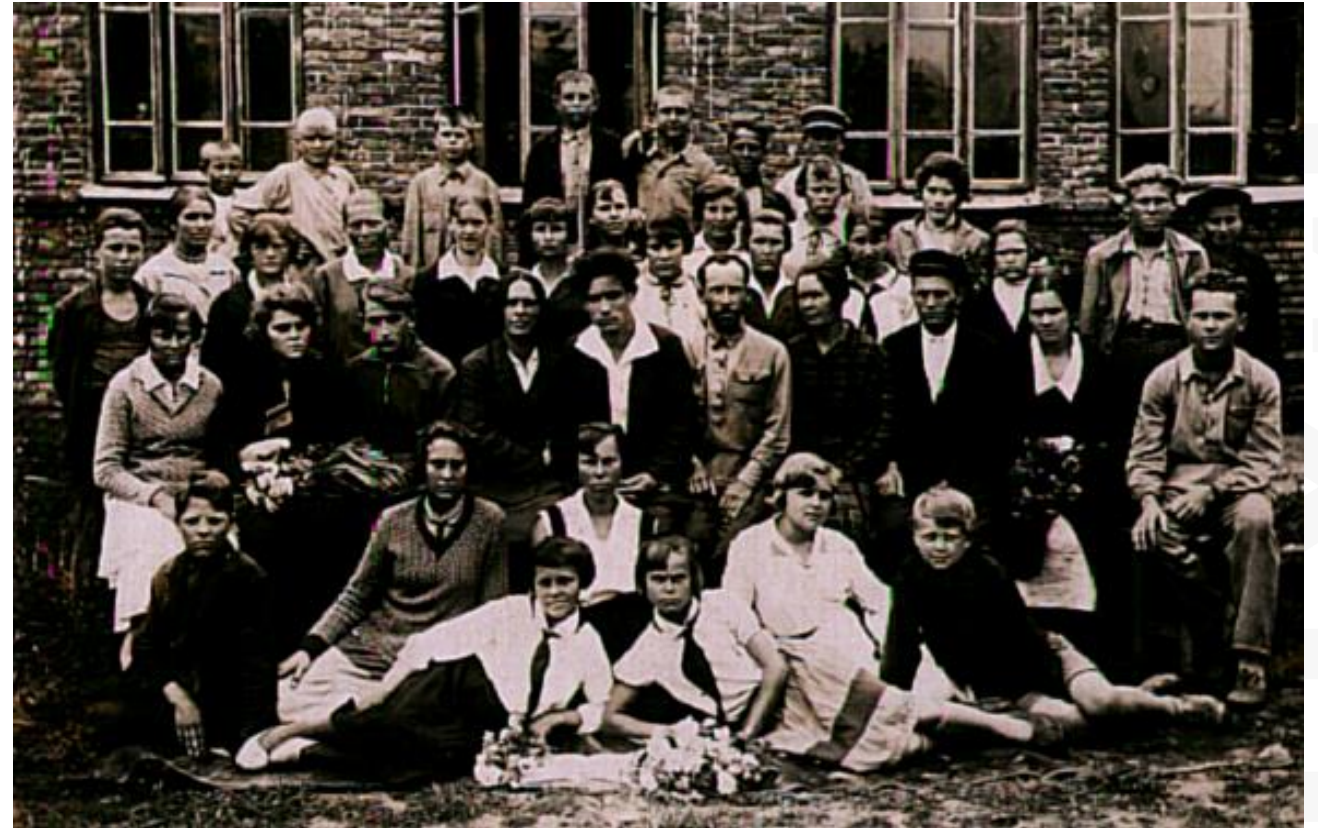
Учителя и ученики средней школы № 10 станицы Ахтырской (1935 г.)

В "Экономическом описании Краснодарского края за 1939 год" указывалось, что вблизи станицы имелись залежи нефти, ранее разрабатывавшиеся французской концессией.