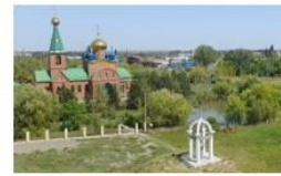
Общественная организация ТОС "Ахтырский"