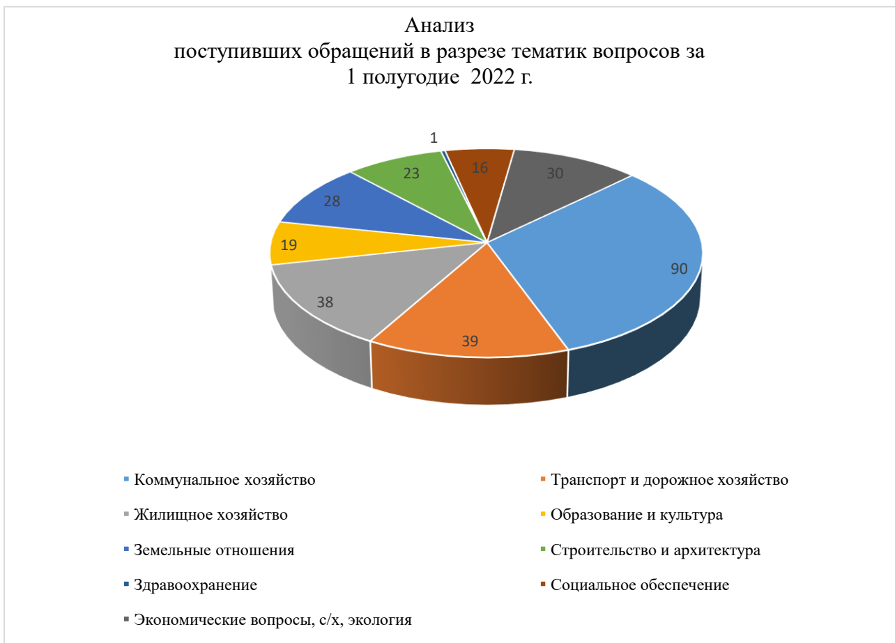
Таблица № 1.

Анализ обращений граждан показал, что в большинстве письменных обращений граждан в 2021 году поднимались вопросы: