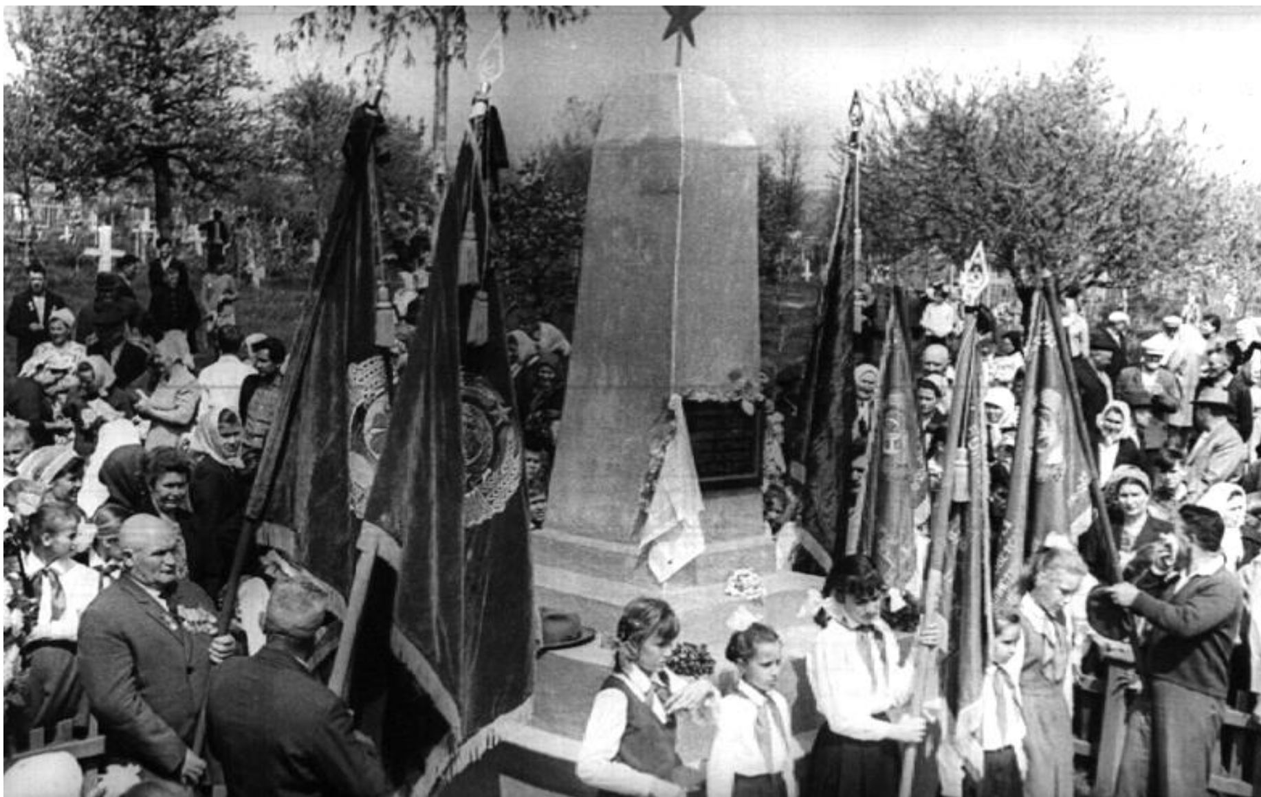
День Победы (09.05.1965 г.)