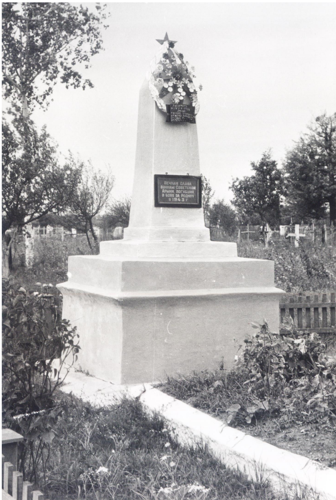
Памятника на кладбище ст-цы Ахтырской (до 09.05.1970 г.).