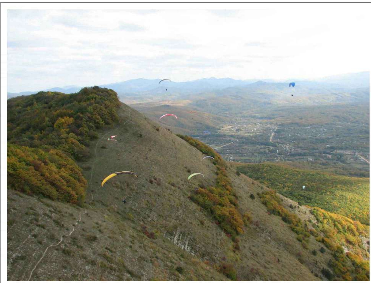
Парашюты над горой Шюве

Примечание: данная карта отредактирована с учетом внесенных изменений, выполненных ООО "ПространствоТерритории" в соответствии с требованиями действующего законодательства на основании муниципального контракта № 191-2015-ОК от 26 августа 2015 года.