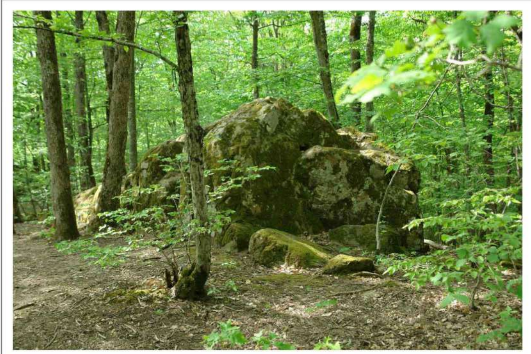
Скала в лесу