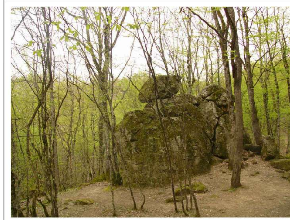
Скала "Чертов папек"