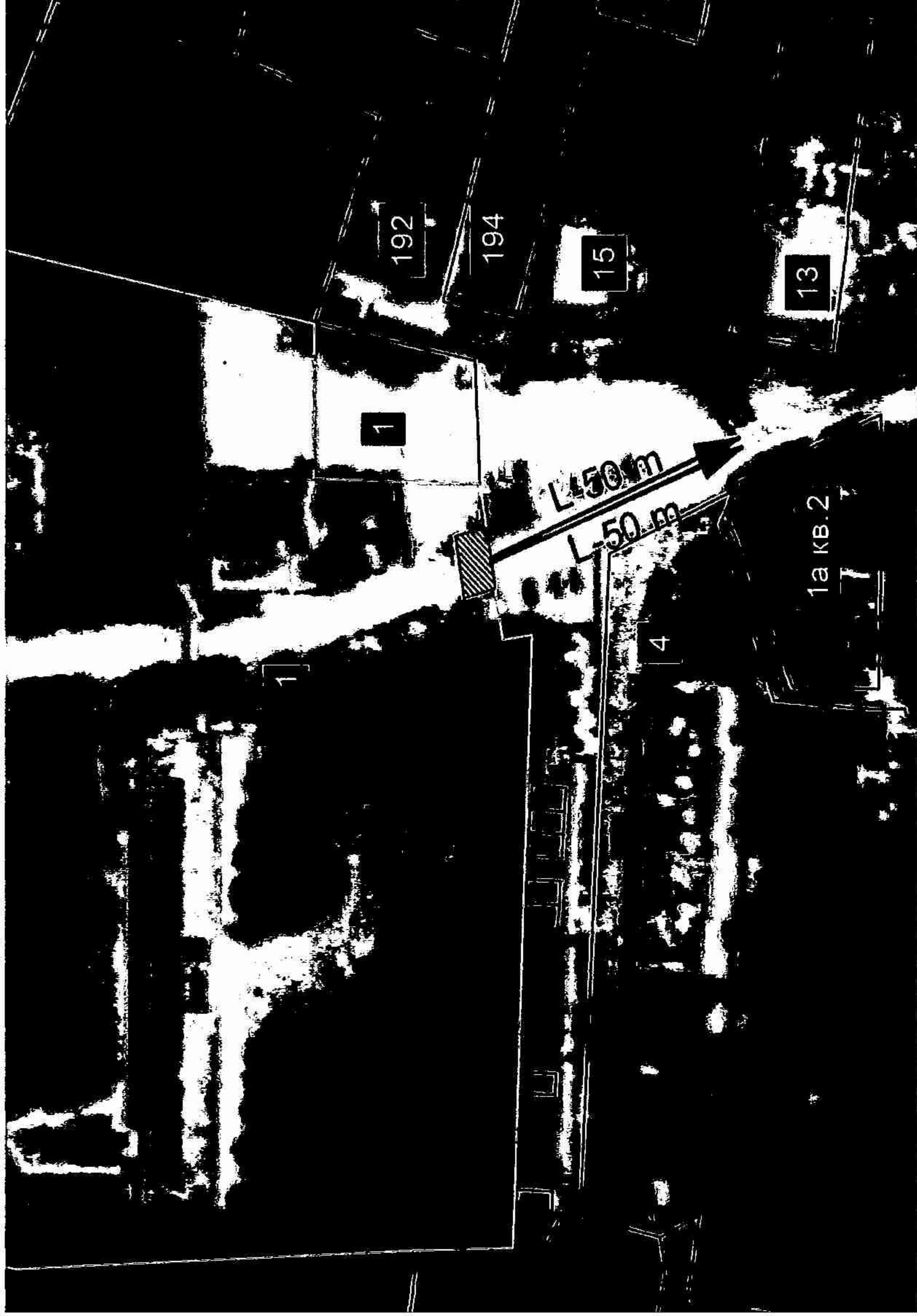
Схема границ территорий, на которых не допускается розничная продажа алкогольной продукции, прилегающих к больнице, расположенной по адресу: ст.Холмской, пер.Победы, 1

к постановлению администрации муниципального образования Абинский район от 10.05.18 № 197