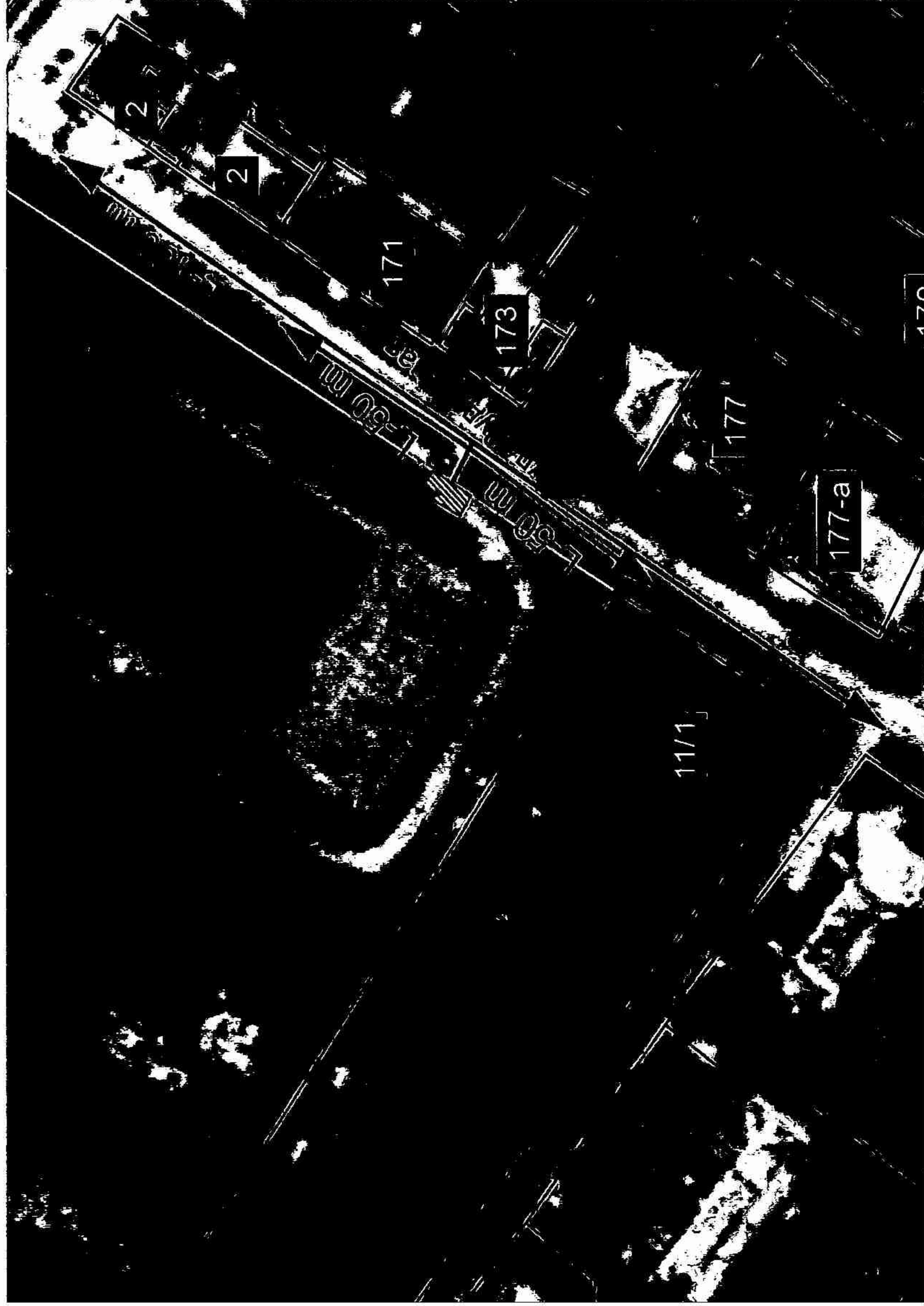
Схема границ территорий, на которых не допускается розничная продажа алкогольной продукции, прилегающих к спортивному сооружению (стадион), расположенному по адресу: ст.Холмская, угол улиц Ленина и Западной

к постановлению администрации муниципального образования Абинский район от 10.05.18 № 404