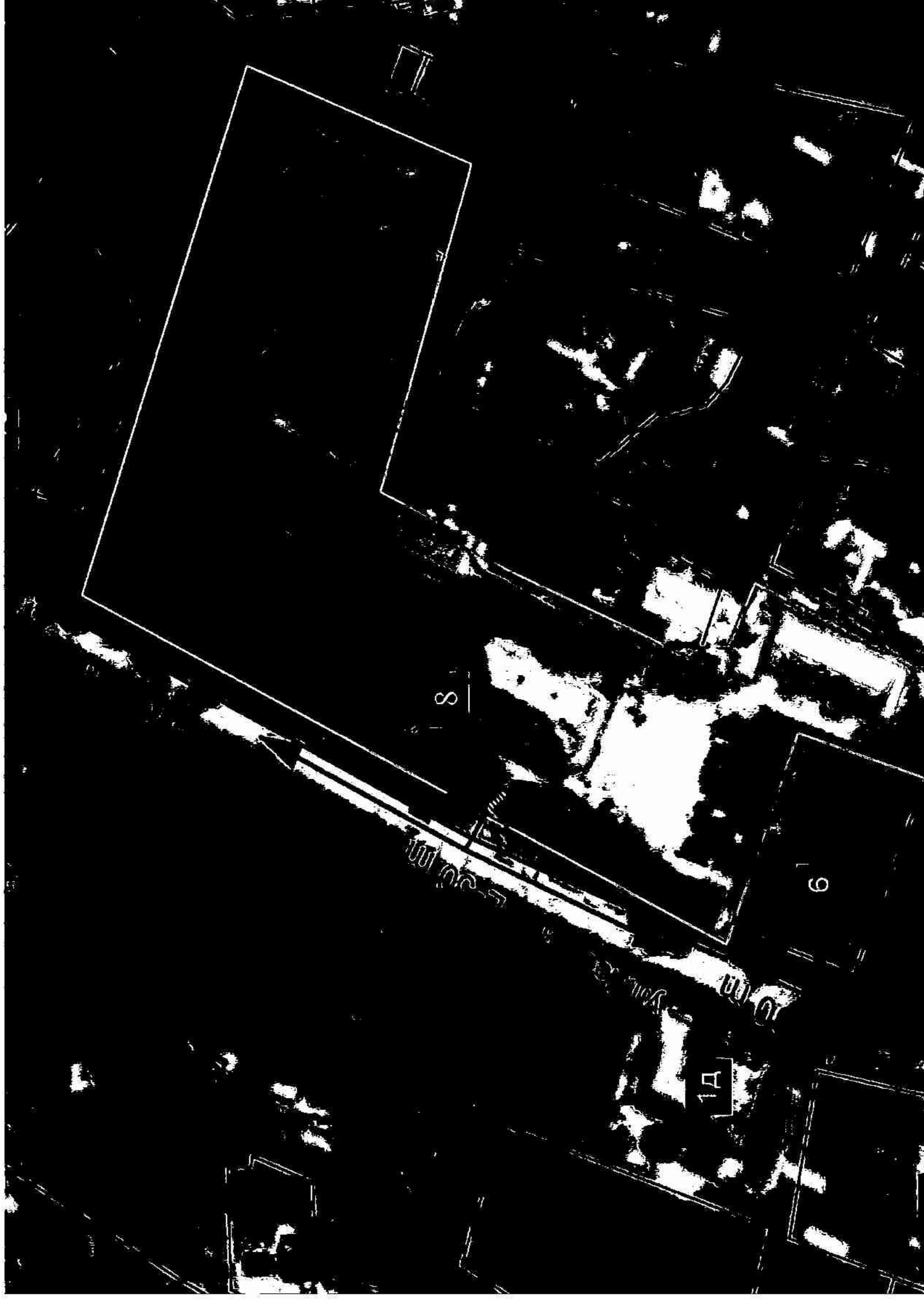
Схема границ территорий, на которых не допускается розничная продажа алкогольной продукции, прилегающих к школе, расположенной по адресу: пос. Синегорск, ул. Лесная, 8

к постановлению администрации муниципального образования Абинский район от 10.05.18 № 404