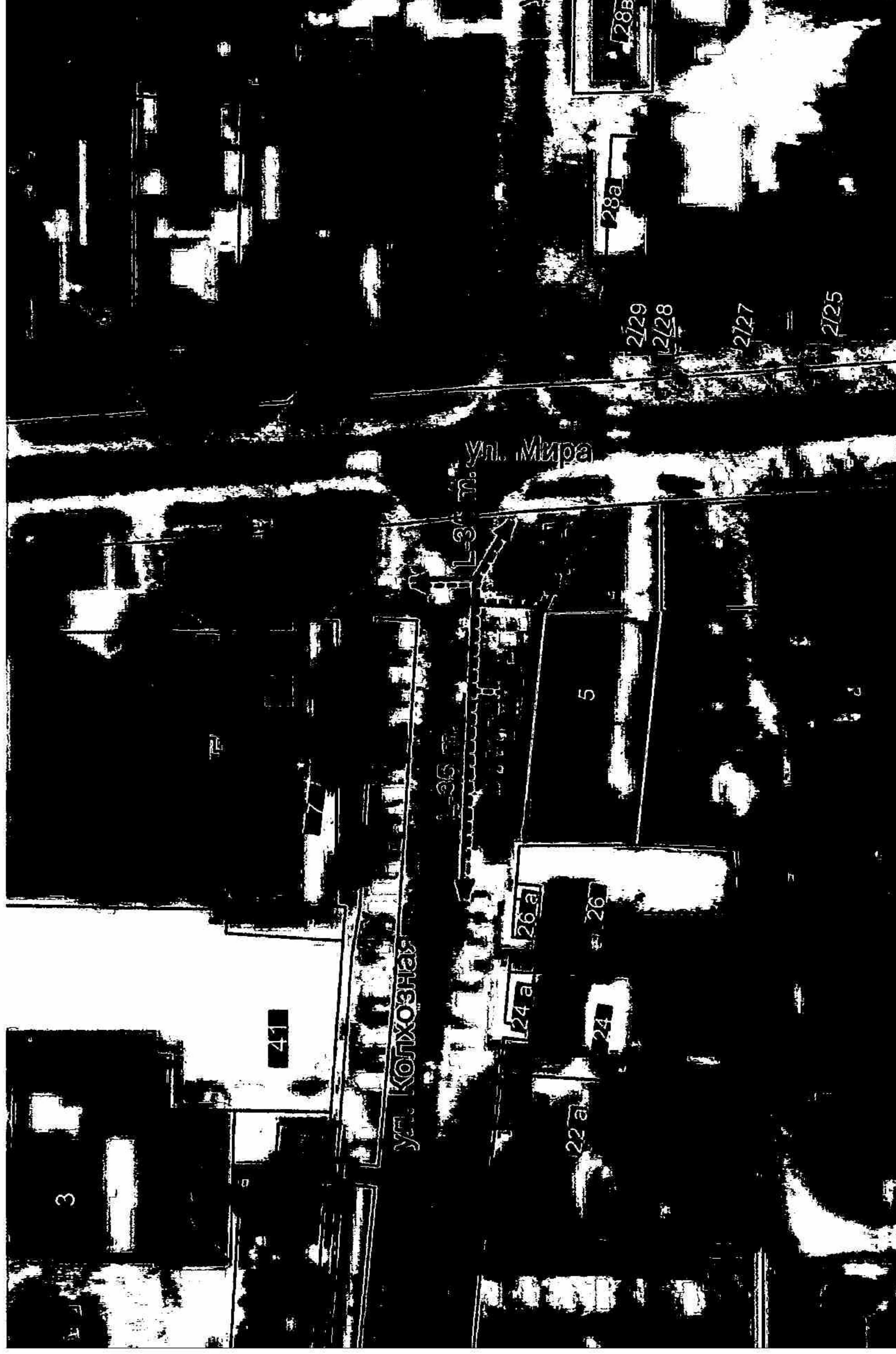
Схема границ территорий, на которых не допускается розничная продажа алкогольной продукции, прилегающих к зданию (медицинский центр «Здоровье»), расположенному по адресу: г.Абинск, ул.Мира, 5

к постановлению администрации муниципального образования Абинский район от 10.05.18 № 404