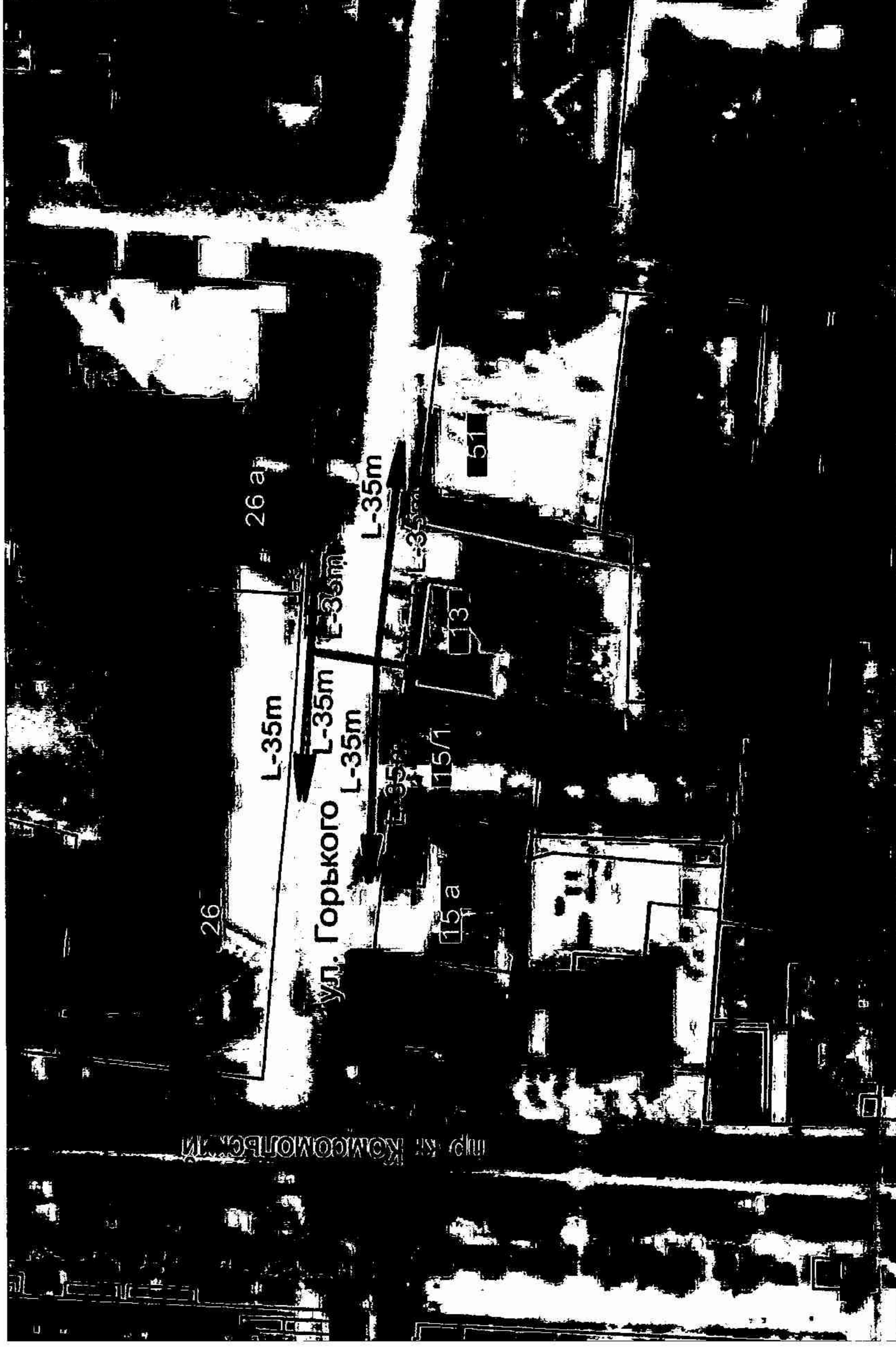
Схема границ территорий, на которых не допускается розничная продажа алкогольной продукции, прилегающих к зданию (стоматологический кабинет «Новая стоматология»), расположенному по адресу: г.Абинск, ул.Горького, 13