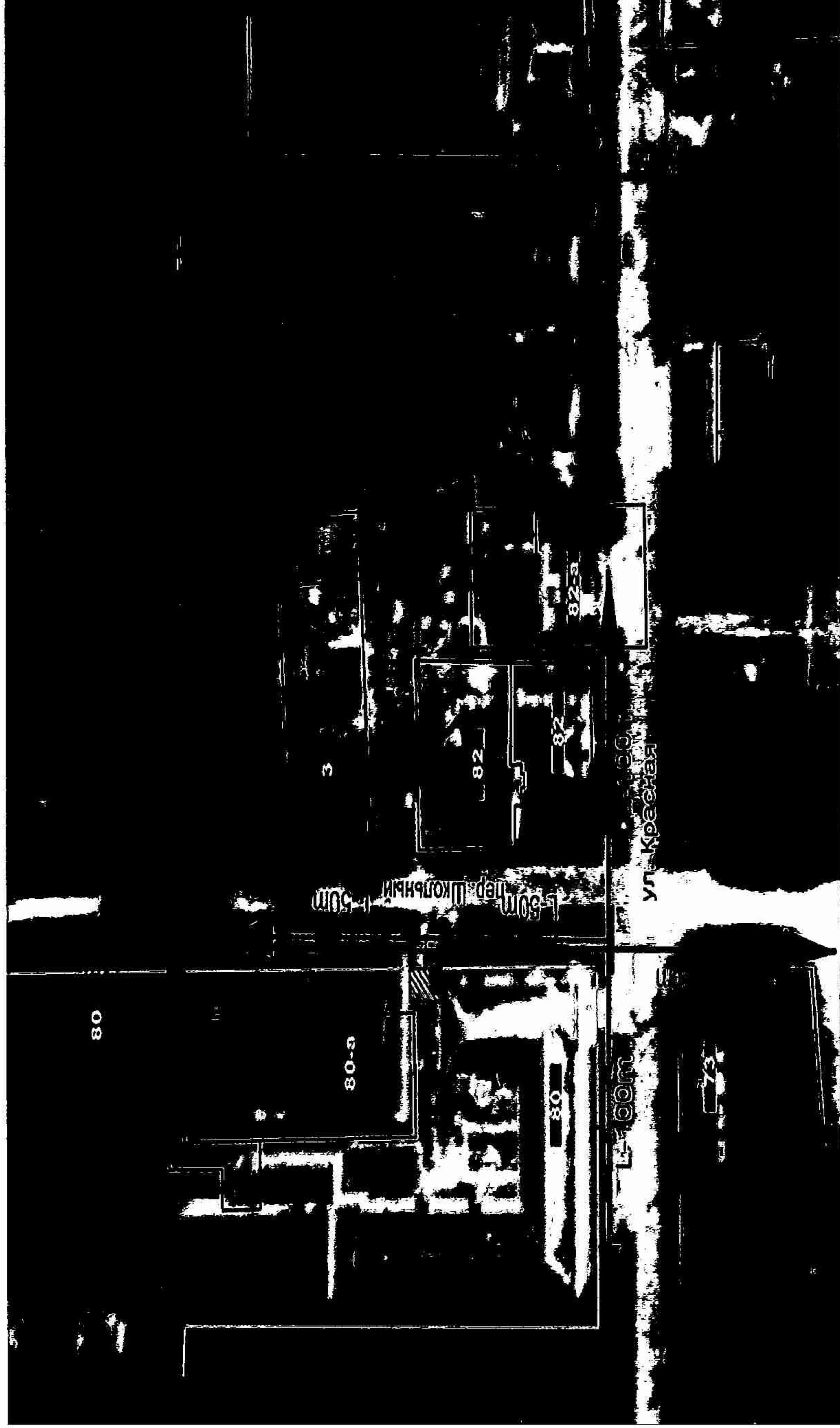
Схема границ территорий, на которых не допускается розничная продажа алкогольной продукции, прилегающих к школе, расположенной по адресу: с.Варнавинское, ул.Красная, 80

к постановлению администрации муниципального образования Абинский район от 10.05.18 № 1197