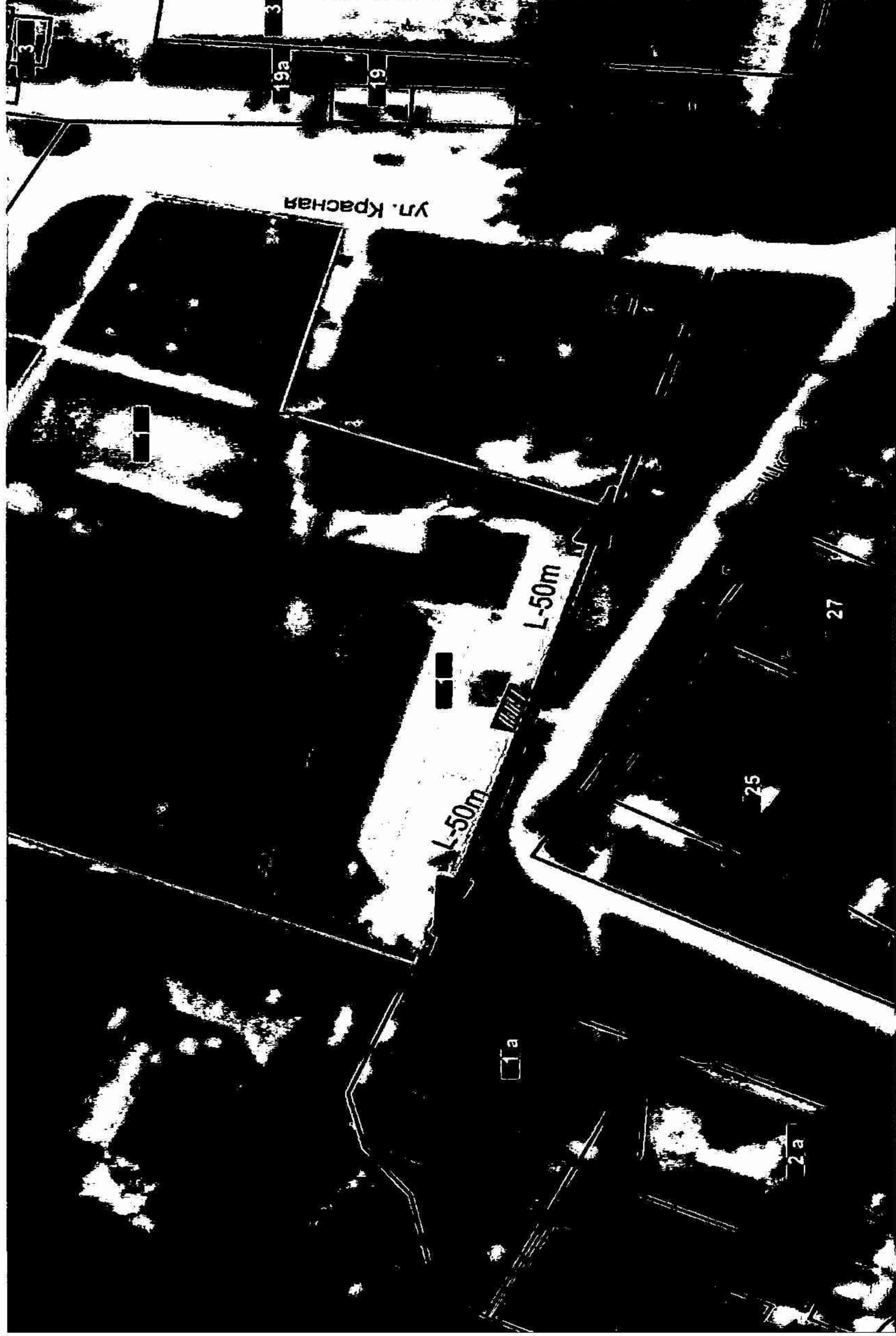
Схема границ территорий, на которых не допускается розничная продажа алкогольной продукции, прилегающих к школе, расположенной по адресу: ст. Федоровская, ул. Школьная, 1

к постановлению администрации муниципального образования Абинский район от 10.05.18 № 497