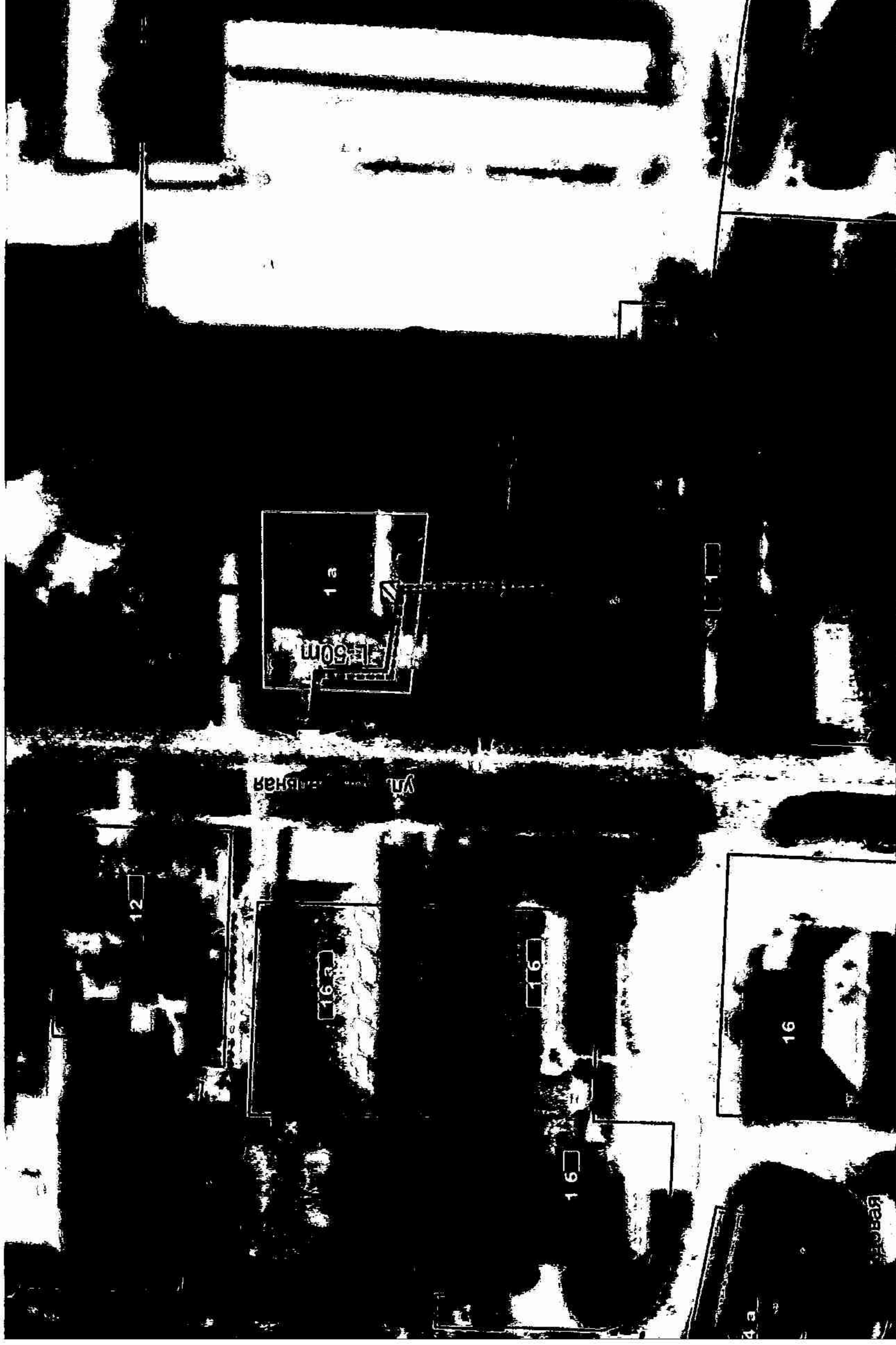
Схема границ территорий, на которых не допускается розничная продажа алкогольной продукции, прилегающих к помещению (фельдшерско-акушерский пункт), расположенному по адресу: с.Светлогорское, ул.Центральная, 1 а